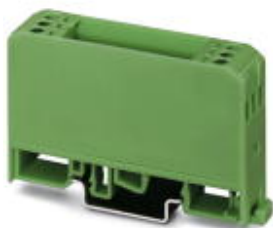
Electronic housing, with universal foot, for p.c.b. insertion, without screw connection terminal blocks and cover, pitch 5

Please be informed that the data shown in this PDF Document is generated from our Online Catalog. Please find the complete data in the user's documentation. Our General Terms of Use for Downloads are valid ( http://phoenixcontact.com/download )