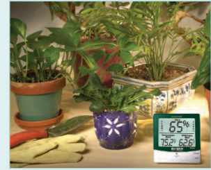
Checks the Humidity and Temperature levels for optimal plant growth in greenhouses.