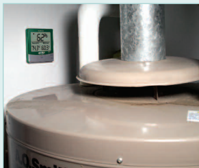
Monitoring Dew Point levels in a Basement for potential mold growth.