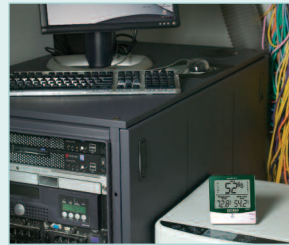
Alerts low Humidity levels in Computer rooms to help prevent electrostatic conditions.