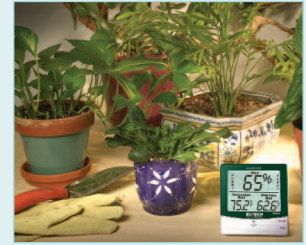
Checks the Humidity and Temperature levels for optimal plant growth in greenhouses.