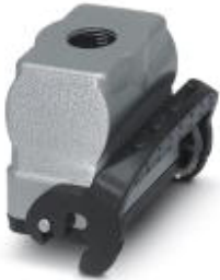
HEAVYCON B6 coupling housing, with single locking latch, height: 62 mm, with 1 x M20 thread, straight cable outlet

Please be informed that the data shown in this PDF Document is generated from our Online Catalog. Please find the complete data in the user's documentation. Our General Terms of Use for Downloads are valid ( http://phoenixcontact.com/download )