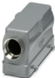
HEAVYCON B24 sleeve housing, for double locking latch, height: 65 mm, with 1 x Pg29 gland, lateral cable outlet

Please be informed that the data shown in this PDF Document is generated from our Online Catalog. Please find the complete data in the user's documentation. Our General Terms of Use for Downloads are valid ( http://phoenixcontact.com/download )